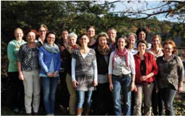
Das Team des Sozialpädiatrischen Zentrums in Mechernich